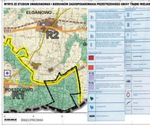
WYRYS ZE STUDIUM WRAZOWYM I KIERUNKÓW ZAGOSPODAROWANIA PRZESTRZENNEGO GMINY TRĄBKÓW WIELKI

Województwo pomorskie Powiat gdański Jednostka ewidencyjna: Trąbków Wielki 220408_2 Ciepła Gołębiewo 0306 Arkusz: 4